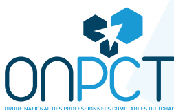
TABLEAU DE L'ORDRE 2020 Compétence, Ethique et Indépendance

Avenue Mobutu, Immeuble AMASOT, B.P.: 5350 Tél : (+235) 66 44 02 53 / 92 77 78 78 contact@onpct-td.org www.onpct-td.org